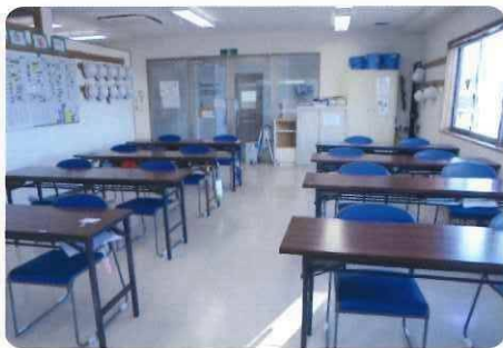
▲ 訓練室(社会適応訓練等)