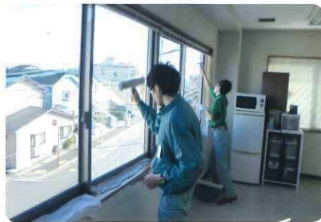
▲ ガラス磨き作業訓練中